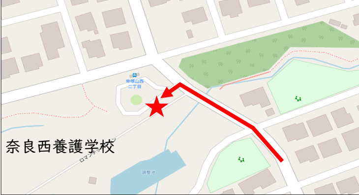
⑤帝塚山西二丁目バス停留所