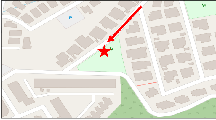
①帝塚山南五丁目第一号街区公園付近