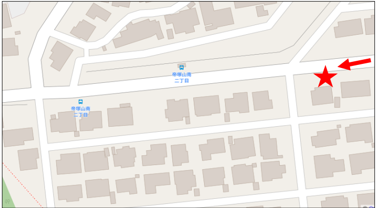
④帝塚山南二丁目バス停留所 (西向き) 付近